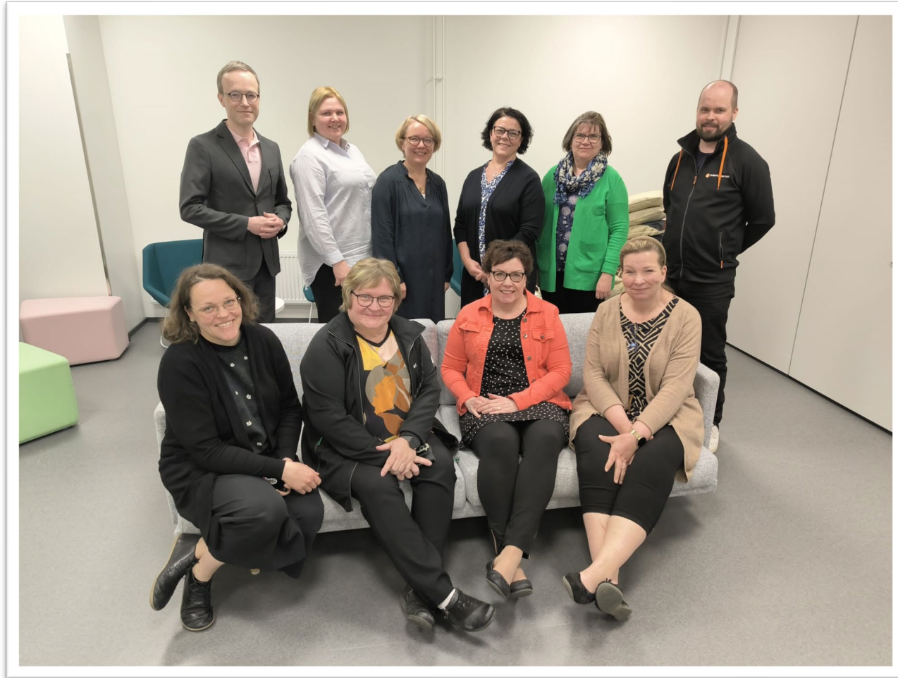
Ohjausryhmän kokouksen 21.5.2024 liveosallistujat