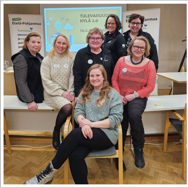
Avaustilaisuus Seinäjoella 14.2.2024